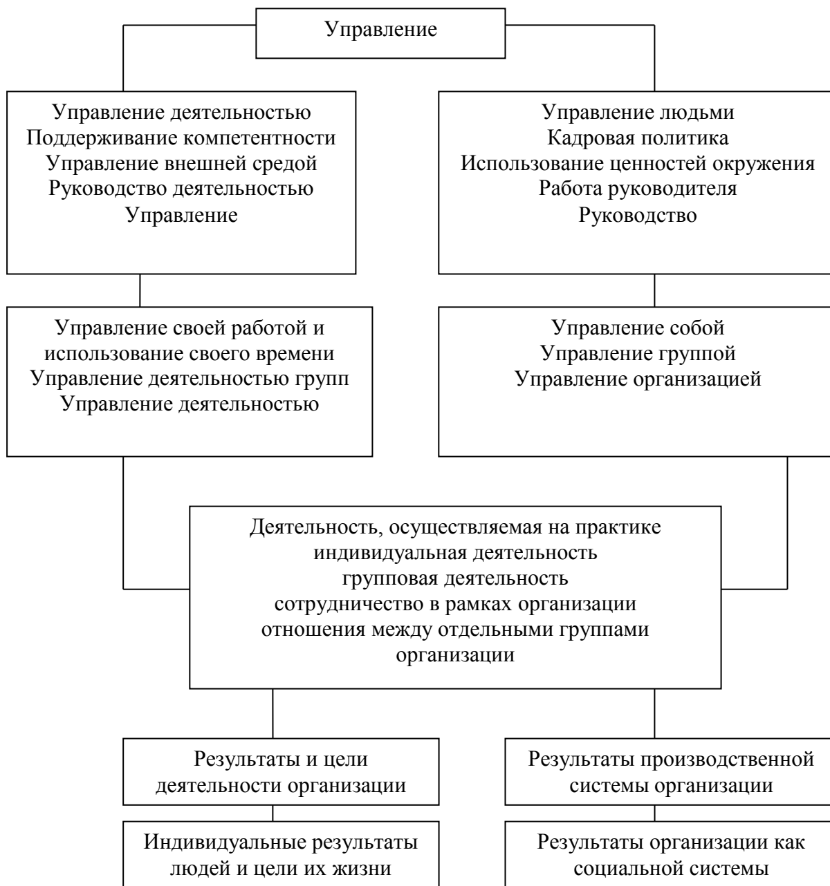
Блок-схема 1 - Схема системы управления [3].

Следовательно, можно предположить, что эффективность управления предприятием зависит от уровня развития личности и сформированности института самоактуализации. В качестве определения института выступает утверждение, что институтом называется группа устойчивых формальных и неформальных правил поведения между агентами.