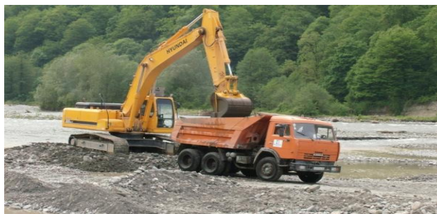
Рис.1. Добыча песчано-гравийной смеси с русла реки Ахк Веденского района ЧР Fig.1. Production of sand and gravel from the bed of the river Akhk Veden district of the Czech Republic

Как известно, ПГС бывает естественного происхождения. Такую смесь добывают со дна рек с использованием земснаряда или же открытым способом с применением экскаваторов там, где имеются пересохшие речные русла (рис. 1).