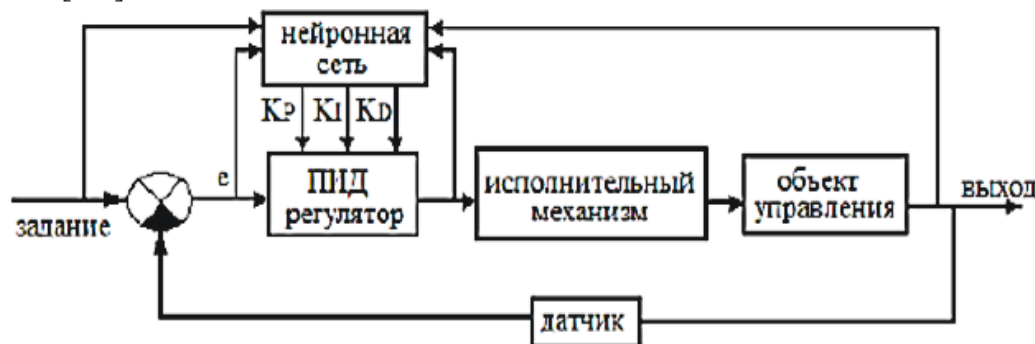
Рис. 1 – Схема управления с нейросетевым оптимизатором параметров регулятора Fig. 1 – Control circuit with a neural network optimizer of controller parameters

Анализ выборки за несколько лет позволит оценить состояние и дать рекомендации по замене тех датчиков, чьи диапазоны измерения приближаются к граничным значениям по точности. АСУ с нейросетевым оптимизатором (рис. 1) позволяет использовать возможности искусственного интеллекта для управления объектом без существенной модернизации системы [1-4].